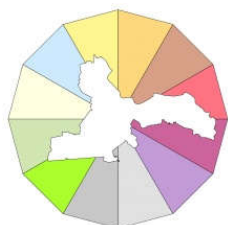
2. attēls. Ķekavas novada teritorijas plānojuma izstrādes logo

Paziņojums par teritorijas plānojuma izstrādes uzsākšanu Ķekavas novada pašvaldības informatīvajā biļetenā „Ķekavas Novads” publicēts 2016. gada 13. decembra laidienā Nr. 12, bet pašvaldības tīmekļa vietnē – 2016. gada 22. decembrī.